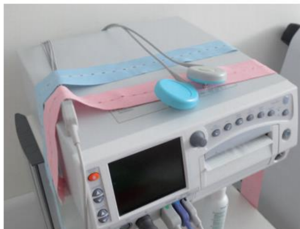
Figura 1. Monitor Cardiotocográfico